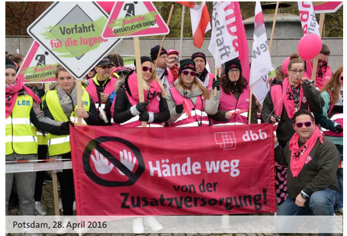
Potsdam, 28. April 2016

Gestartet waren die Kommunen mit einem Generalangriff auf das Leistungsrecht. Es ist uns gelungen, dies abzuwehren. Auch haben wir nicht zugelassen, dass alle Versorgungskassen pauschal Gelder erhalten. Bei den Zusatzversorgungskassen, bei denen die dauerhafte Finanzierbarkeit der Betriebsrenten gefährdet war, haben wir einer Erhöhung des Eigenanteils der Beschäftigten zugestimmt.