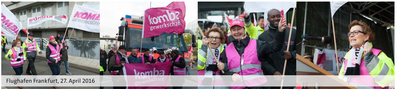
Flughafen Frankfurt, 27. April 2016

friedigend“ zu bewerten. Doch ist es uns in jedem Falle gelungen, die Teilhabe der Beschäftigten an der guten wirtschaftlichen Lage zu sichern und strukturell nachhaltige Verbesserungen durchzusetzen.“