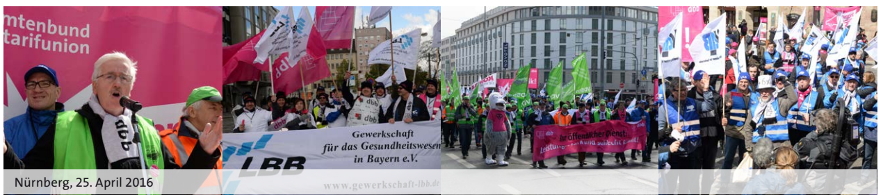
Nürnberg, 25. April 2016

Der dbb hat den Wegfall der zwingenden Stufe 1 (EG 15) nach dem bisherigen Übergangsrecht erreicht, so dass nunmehr die Einstufung bei Neueinstellungen und mit einschlägiger Berufs-