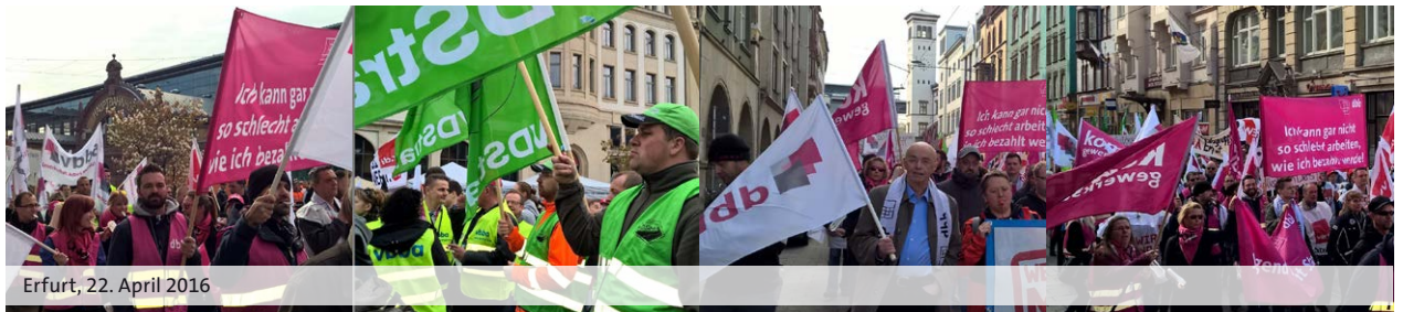
Erfurt, 22. April 2016