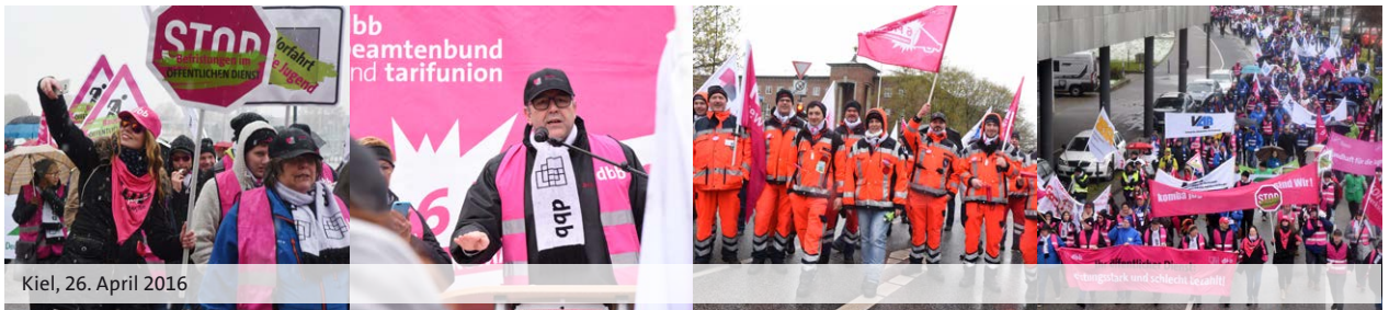
Kiel, 26. April 2016

erfahrung von mindestens einem Jahr in Stufe 2, bei einschlägiger Berufserfahrung von drei Jahren im Regelfall in Stufe 3 möglich ist. Das bedeutet Verbesserungen beim Einstiegsentgelt von 468,67 € (Stufe 2) bzw. 643,15 € (Stufe 3).