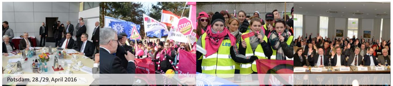
Potsdam, 28./29. April 2016