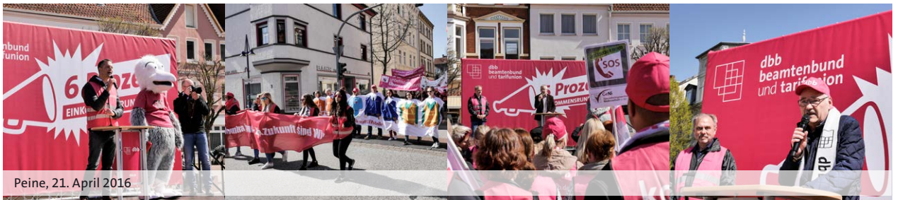
Peine, 21. April 2016