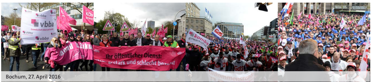
Bochum, 27. April 2016

Verhandlungs- und Bundestarifkommission des dbb haben das Ergebnis ausführlich diskutiert. Am Ende stimmten beide Kommissionen mit großer Mehrheit für die Annahme des Kompromisses. „So eindeutig wie das Abstimmungsergebnis ist die Diskussion keineswegs verlaufen“, erläuterte Russ vor den Medien. „Aber bei einer solchen Vielzahl von schwierigen Sachthemen, von A wie Azubis bis Z wie Zusatzvorsorge, ist das Ergebnis nicht einfach mit „gut“ oder „be-