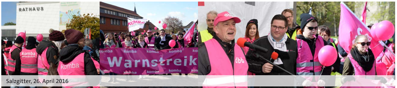
Salzgitter, 26. April 2016

In Bezug auf die im letzten Jahr vereinbarte Neuregelung der Übergangsvorsorge für Beschäftigte im feuerwehrtechnischen Einsatzdienst der kommunalen Feuerwehr wurde vereinbart, dass die Beschäftigten auch während ihrer Freistellungsphase von den zukünftig vereinbarten Entgelterhöhungen profitieren.