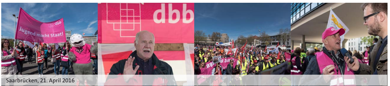
Saarbrücken, 21. April 2016

Ab dem 1. März 2017 wird die betragsmäßige Höhergruppierung durch die stufengleiche Höhergruppierung abgelöst. Damit wurde eine jahrelang vom dbb geforderte Regelung vereinbart. Sie wirkt jedoch noch nicht für Höhergruppierungen aufgrund Inkrafttretens der Entgeltordnung, sondern für Umgruppierungen ab März 2017.