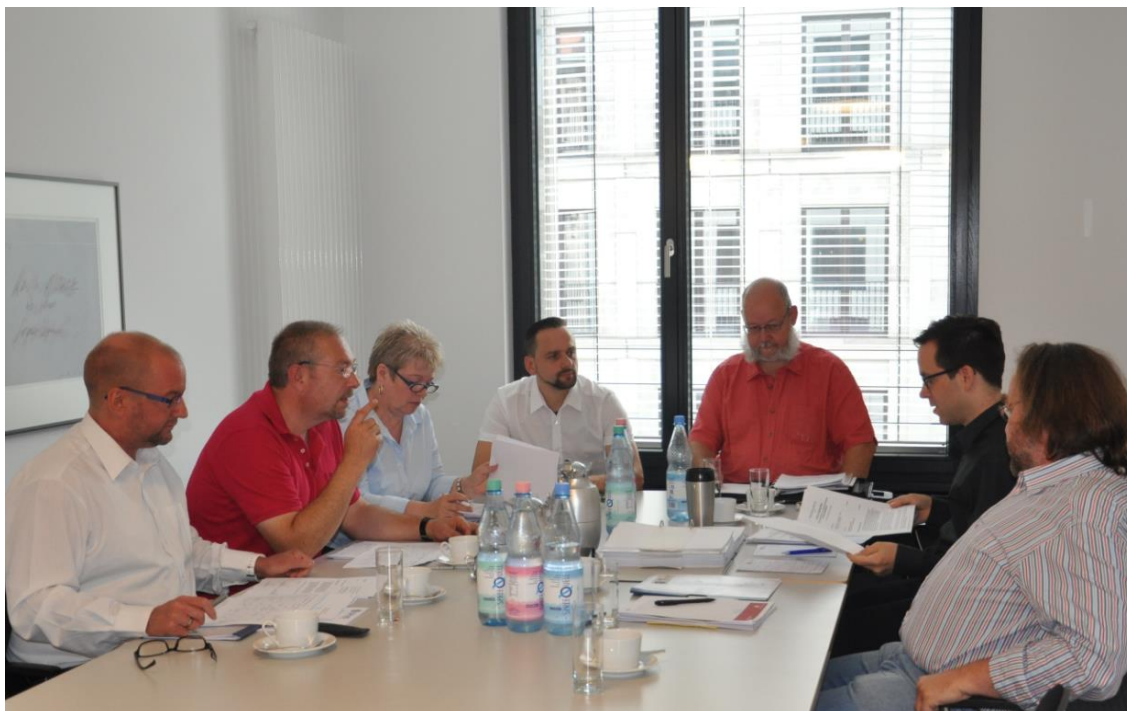
Verhandlungskommission des dbb

Für uns ist klar, dass die Sicherheitskräfte in Tegel und Schönefeld eine deutliche Aufwertung ihrer Arbeit verdienen! Vor der endgültigen Festlegung der Forderungen werden wir mit unseren Mitgliedern die Möglichkeiten diskutieren und im Anschluss die Forderungen beschließen und veröffentlichen.